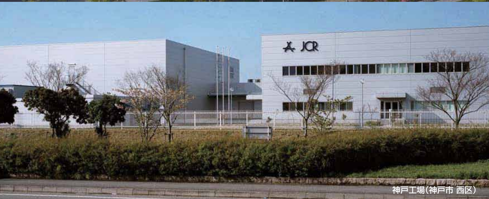
神戸工場(神戸市 西区)