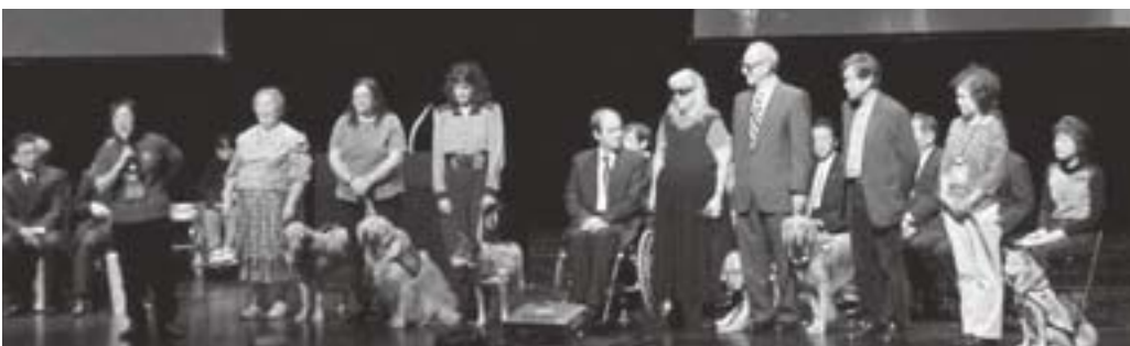
▲アメリカ、カナダ、イギリス、及び日本の補助犬使用者と盲導犬、介助犬、聴導犬による会議3日間