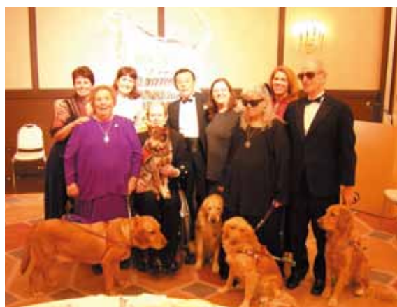
第1回国際補助犬パートナーズ会議 in 松本 チャリティ食事会