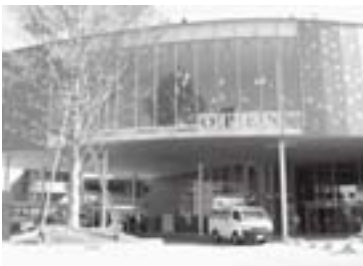
▲まつもと市民芸術館にて柿落しのプログラムの1つとして開催