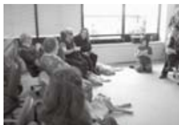
▲厚生労働省社会参加推進室室長と会見 日本での補助犬普及を訴える