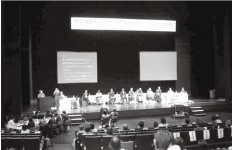
▲2004年11月 第1回「国際アシスタンス・ドッグ・パートナーズ会議」in松本 開催

2009年9月に急逝されたEames博士の死を悼みます。IADP国際会議を通して、IAADP元会長故Ed Eames博士の遺志を私たちは継承していきます。写真は、2004年第1回「国際アシスタンス・ドッグ・パートナーズ会議」in 松本での博士の遺影。