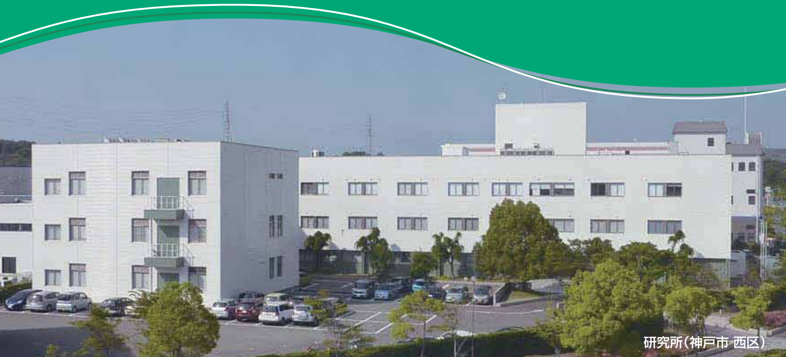
研究所(神戸市 西区)